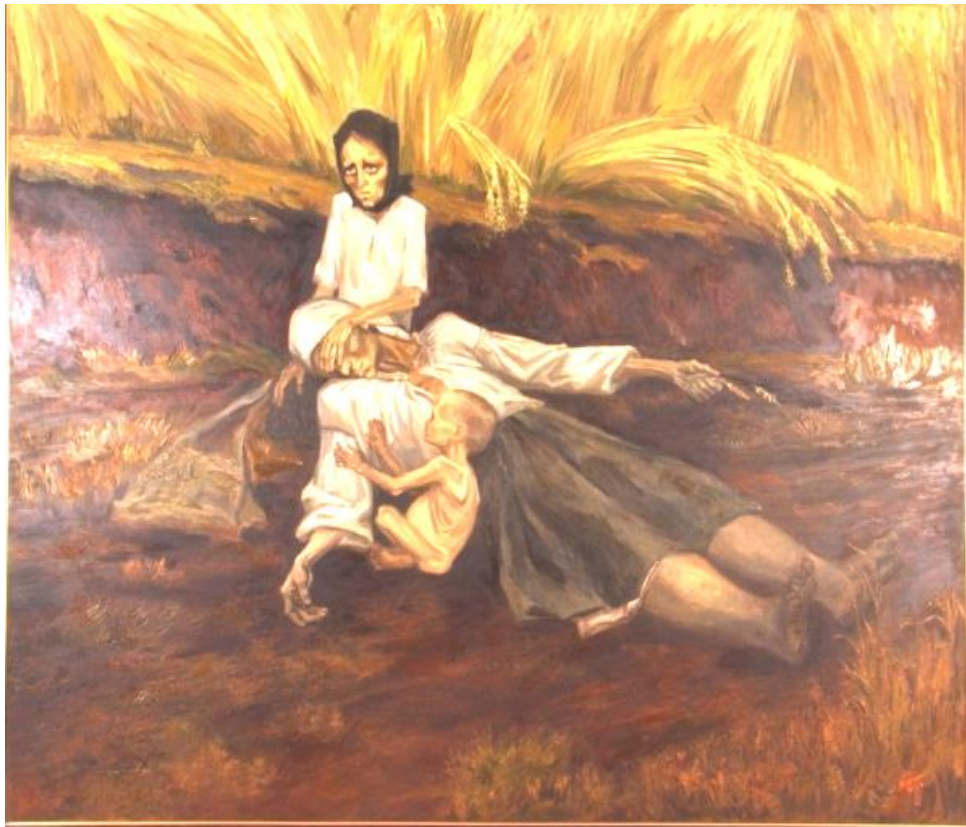
Ніна Марченко “Мати 1933 р.” (2000 р.)