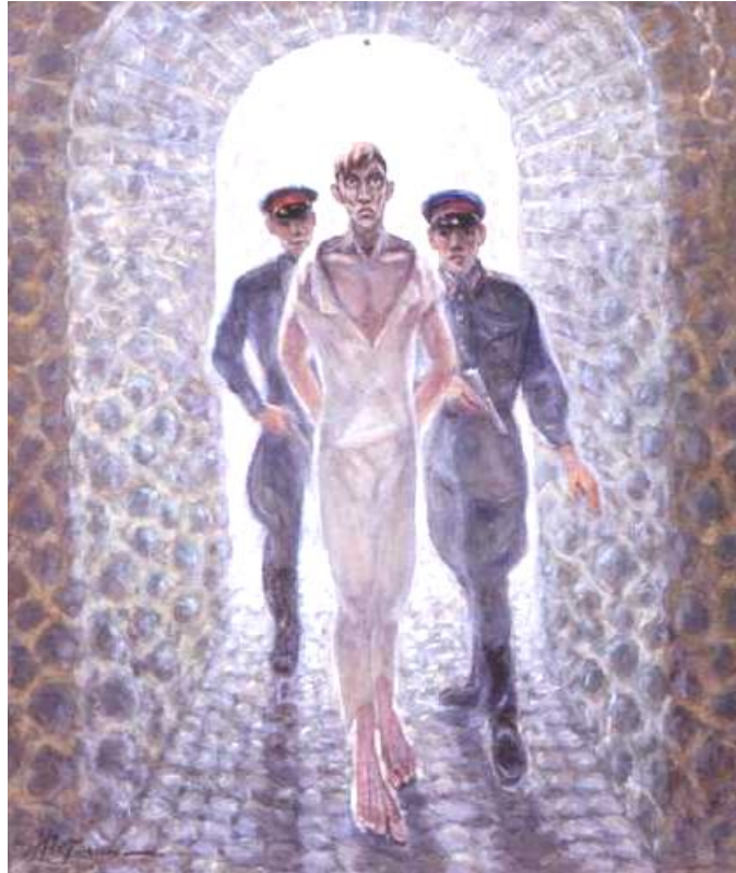
Микола Гетьман “У підвалах НКВД (пам’яті брата)” (1960 р.)