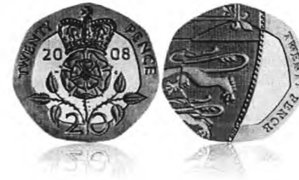
20-пенсові монети з 1982 – 2008 рр. з тюдорівською трояндою (United Kingdom 20p Coin. [Електронний ресурс] Режим доступу: http://www.royalmint.com )

This article is about the kings symbol in mediaval England. The author means, that the roses were as a symbols not only in the Roses war during 1455 – 1485, but also in the XXth in the Second World war.