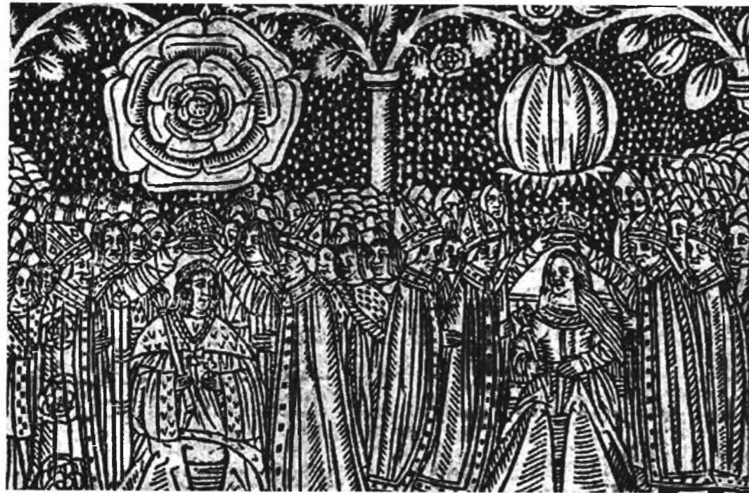
Гравюра по дереву XVI ст. із зображенням одруження Генріха VIII з Катериною Арагонською і їхніх особистих емблем. ([Електронний ресурс] Режим доступу: http://www.ngfl.ac.uk/tudorhistory/gallery2.html )