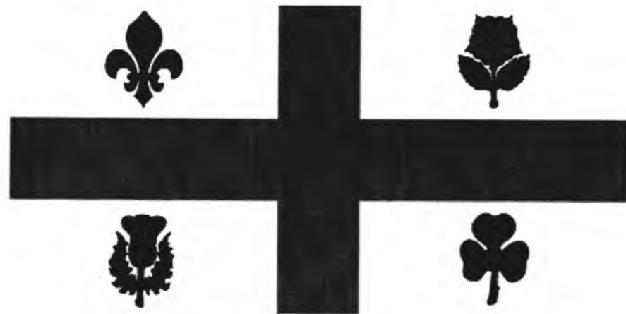
Прапор міста Монреаль (Квебек, Канада)