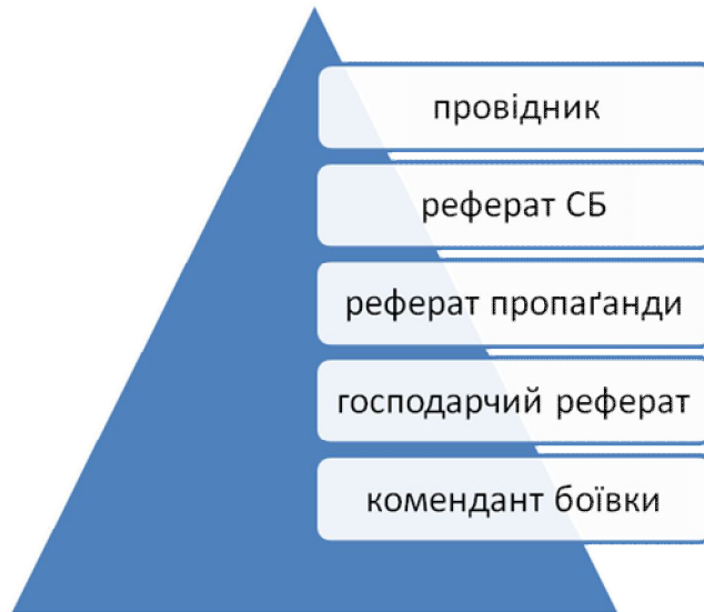
Організаційна структура проводу III району надрайону “Левада”