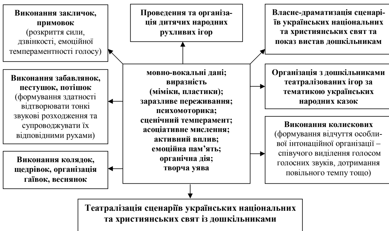
Рис. 1. Модель формування акторських умінь майбутніх вихователів засобами українського фольклору

Природа театру синкретична, адже театр – це і драматургія, і сценографія, і музика, які плавно зливаються у одне ціле в процесі сценічної дії. Основою цієї сценічної дії завжди виступає актор, техніці гри якого надається означення свідомої [Станіславський К., Виготський Л.], а зверненню до глядачів – вихованого психолого-педагогічного значення [Баталов А., Зязюн І., Падалка Г., Соломарський О.].