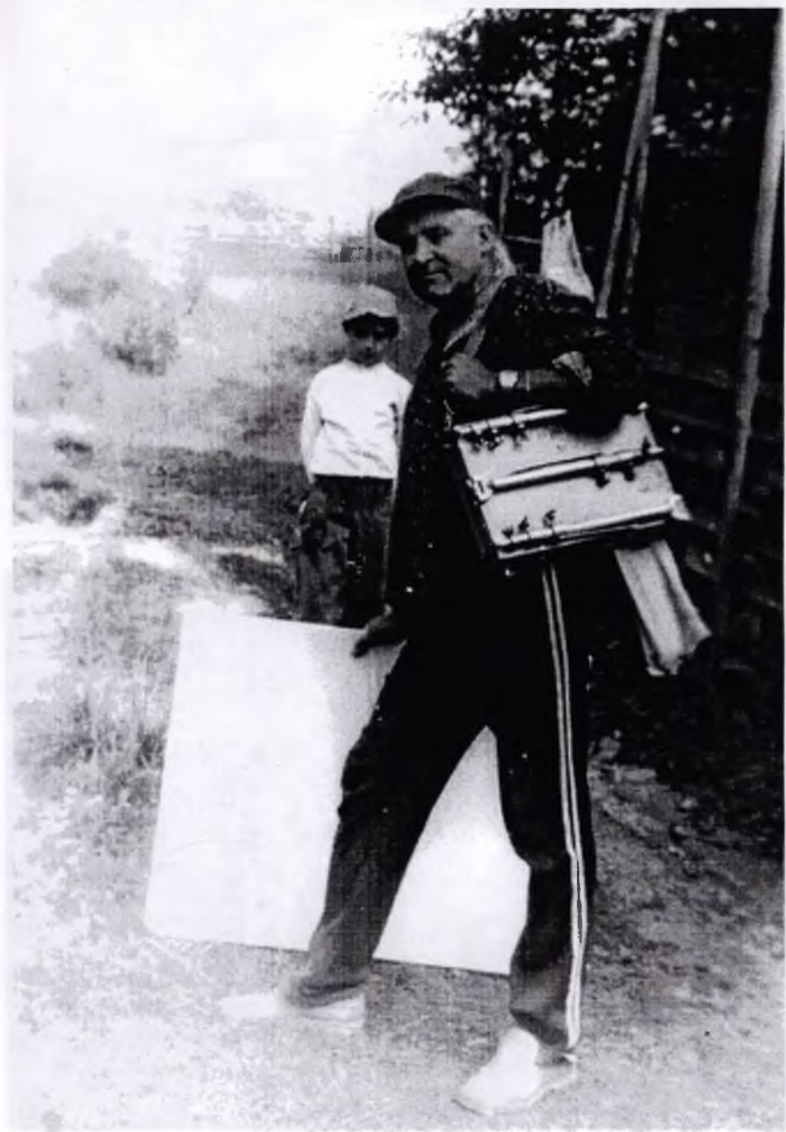
8. На пленер. Ворохта. 1986