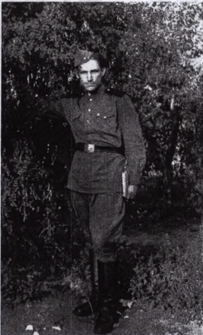
1. В армійській службі на Далекому Сході. 1948

1. Все життя радом. Телера і Милана Губина ...qq it-0V дооправо Г нп 1 2.