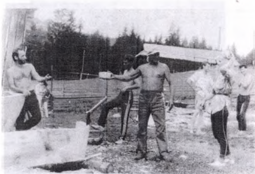
9. Реконструкція човна з Галичиної могили. 1997