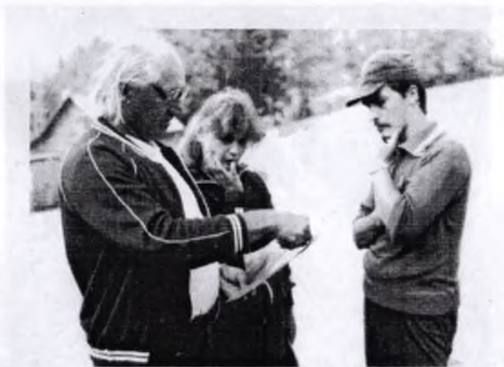
7. Зі студентами в Ворохті. 1987