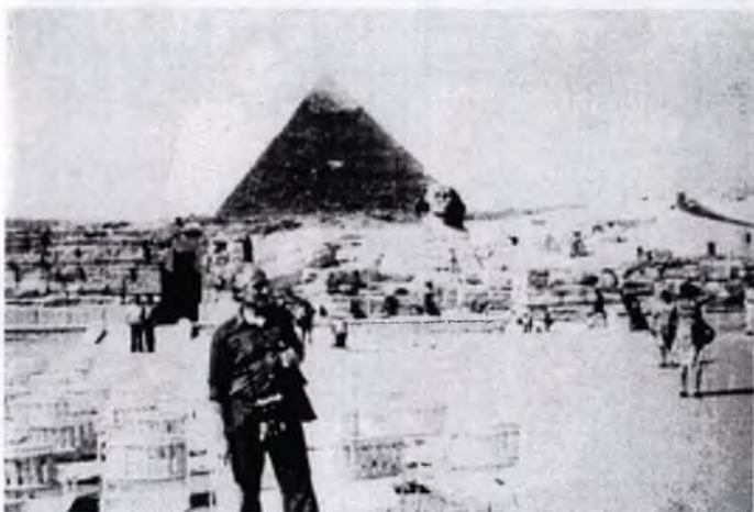
4. Єгипет. Гіза. 1981.