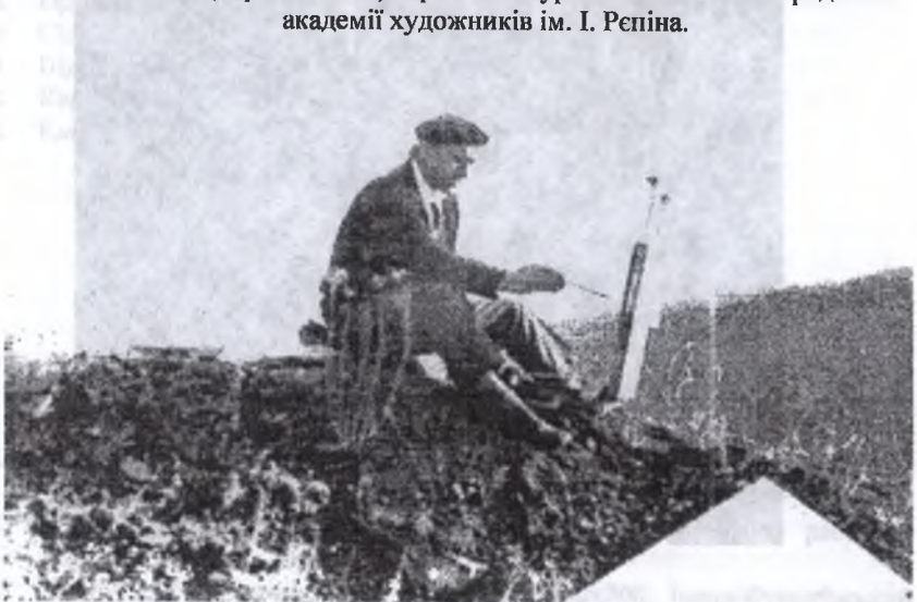
3. Під Говерлюю. 70-ті рр.