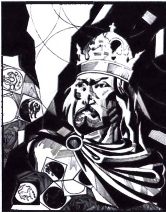
«Князь Данило Галицький»