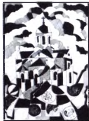
«Церква Святого Пантелеймона»