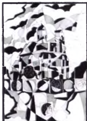
«Церква Святої Богородиці»