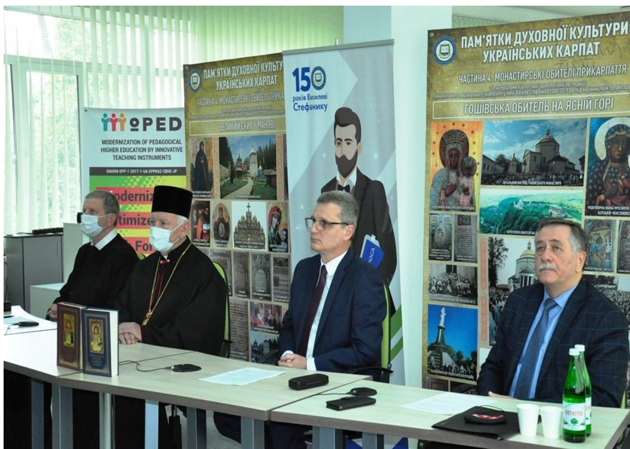
Презентація другого тому видання «Гошівська обитель Богородиці на Ясній Горі в Карпатах» (22 квітня 2021 р.)