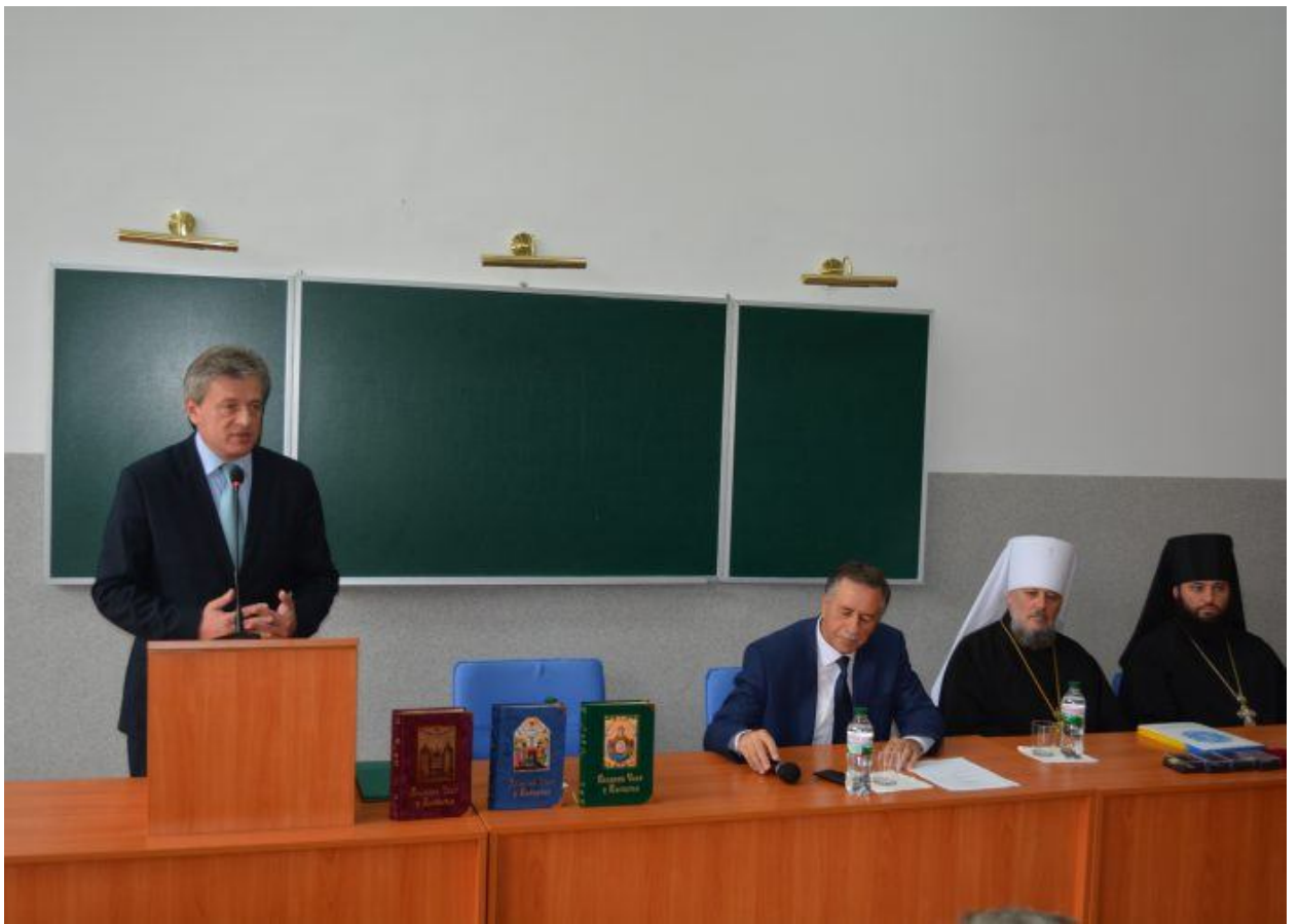
Презентація тритомного видання «Великий Скит у Карпатах» (22 вересня 2017 р.).