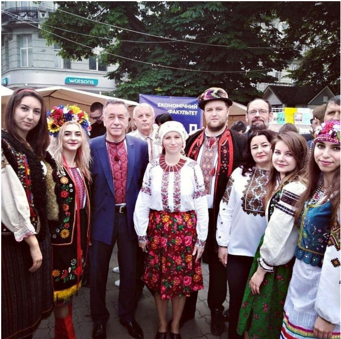
Участь кафедри етнології і археології у Фестивалі науки Прикарпатського національного університету імені Василя Стефаника на Вічевому майдані м. Івано-Франківська (25 травня 2019 р.)