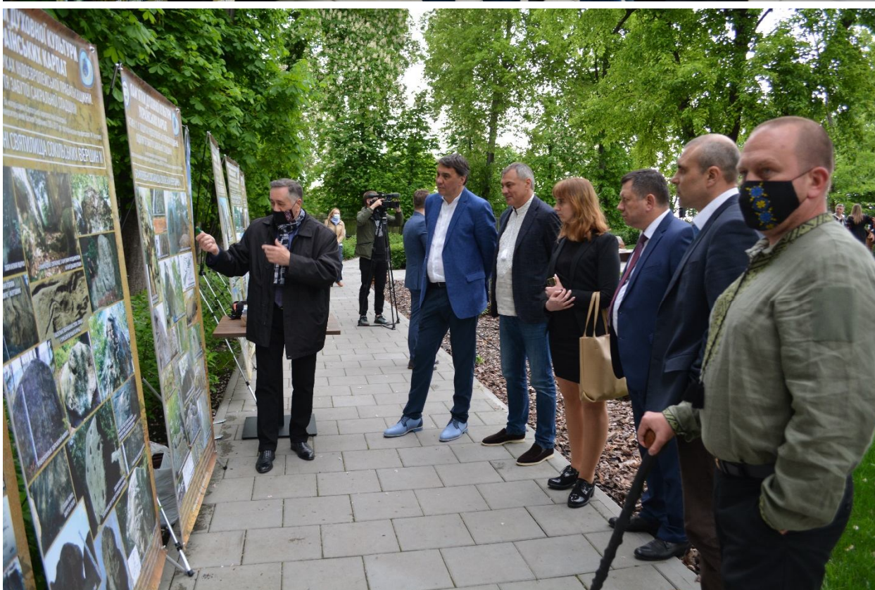
Виставка «Пам'ятки духовної культури Українських Карпат» у рамках проекту «Таємниці України для тебе» (м. Київ)