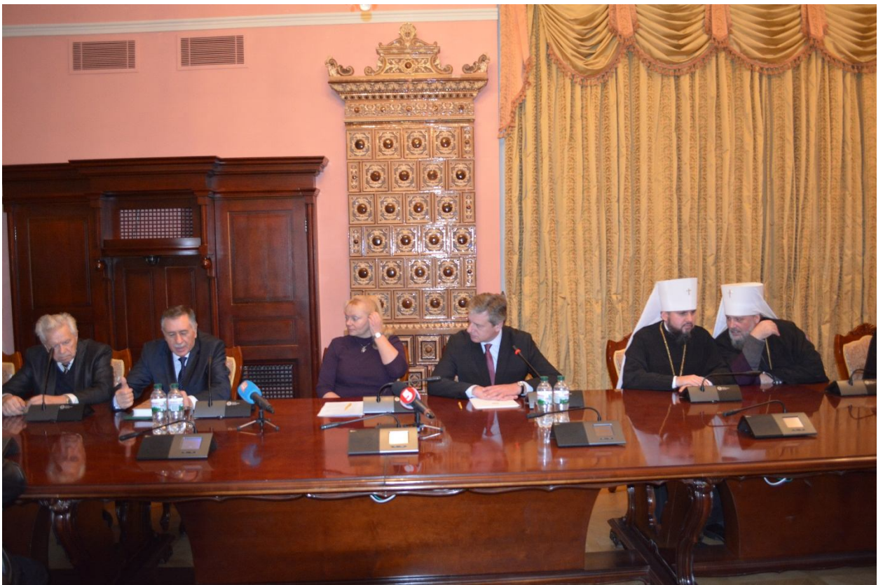
Презентація видання «Великий Скит у Карпатах» у Національному заповіднику «Софія Київська» (5 грудня 2017 р.)