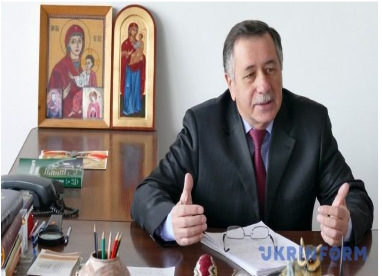
Інтерв'ю з журналісткою УКРІНФОРМу про Манявський Скит на Прикарпатті (7 лютого 2016 р.)