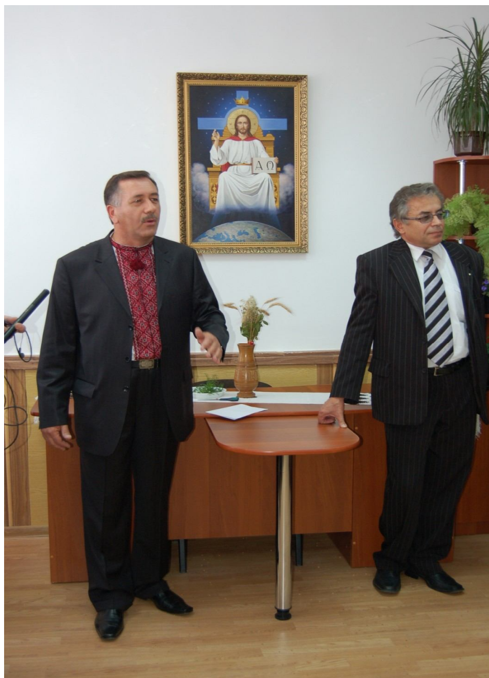
Відкриття кафедри етнології і археології (2006 р.)