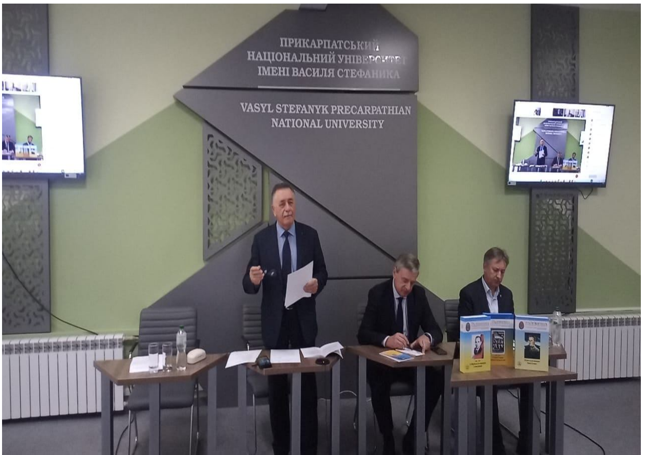
Всеукраїнська наукова конференція «Українська повстанська армія в боротьбі проти нацистського і більшовицького тоталітарних режимів» (до 80-річчя створення УПА) 12 жовтня 2022 р.