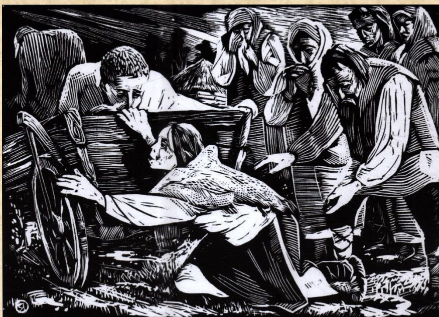
Худ. Я. Оленюк. "Катруся".

Творчість В. Касіяна мала й має великий вплив на розвиток української графіки. Не лише його численні учні, а й чимало інших художників, звертаючись до багатющого мистецького й технічного досвіду майстра, зазнали на собі його вплив.