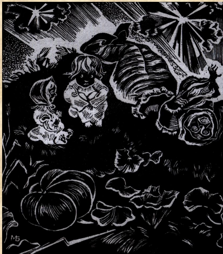
Худ. М. Бутович. 1933. “Діточа пригода”.

Вдруге ці дереворити були надруковані за життя Стефаника (1933 р.) завдяки видавничій спілці “Діло” у Львові. Тут же було вміщено дереворити М. Бутовича: титульні сторінки до збірок “Дорога”, “Земля”, ілюстрації до новел “Давнина”, “Злодій”, “Марія”, “Діточа пригода”. Невідомо, чи відгукнувся письменник на це видання.