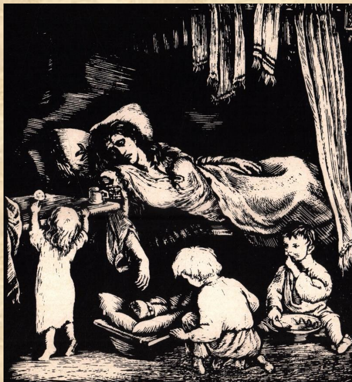
В. І. Касіян. Ілюстрація до новели “Кленові листки”. Хвора мати. 1926. Дереворит.