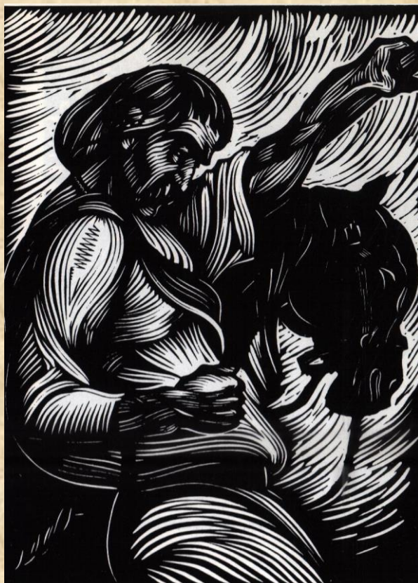
Худ. Д. Лазаренко. "Камінний хрест". Гравюра. 1970.