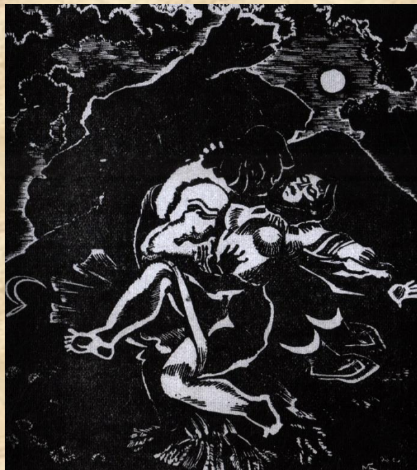
Худ. М. Бутович. 1933. "Марія".

Творчість В. Касіяна мала й має великий вплив на розвиток української графіки. Не лише його численні учні, а й чимало інших художників, звертаючись до багатющого мистецького й технічного досвіду майстра, зазнали на собі його вплив.