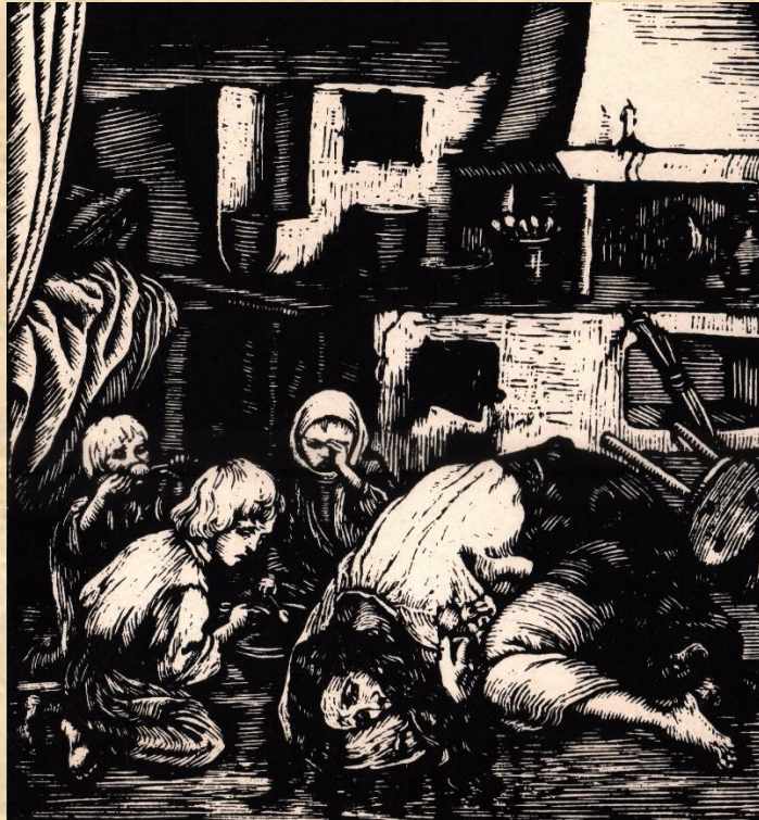
В. І. Касіян. Ілюстрація до новели “Кленові листки”. Мати вмирає. 1926. Дереворит.

“Вмираюча мати” – досягає вражаючої, трагічної сили.