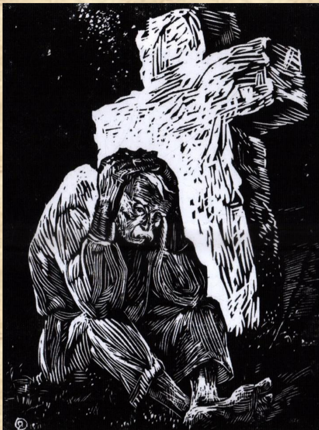
Худ. Я. Оленюк. "Камінний хрест".